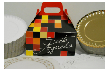
CAJA RELIQUIA DE SANTA AGUEDA, 25 UDS, RODALES B.O. 21 (100uds) RODALES CALADOS LITO 21 (100uds) PLATOS ESTRIADOS N.02 16 CM.(200uds) PLATOS ESTRIADOS ORO N.02 16CM.(200ud)