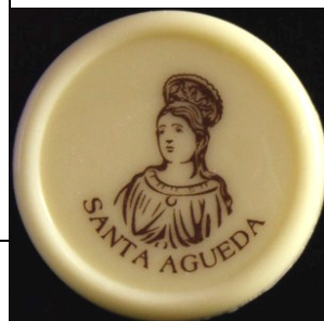
ANAGRAMA SANTA AGUEDA PEDIDO MINIMO 90 UDS CHOCO BLANCO