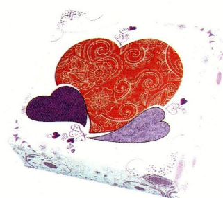
CAJA 20x20x8, 50UDS CAJA 25x25x8, 50UDS

CREMA PASTELERA ELABORACION EN FRIO DOLCECREM (FRICREM) SACO 15 KGS