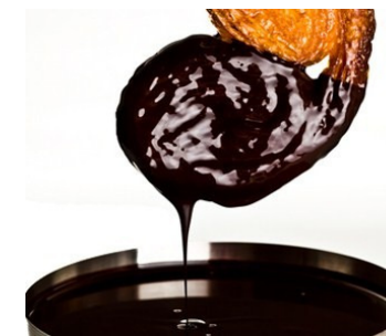
COBERTURA VEGETAL NEGRA CHOCOVIC 0 AJA 20 KG, P200, CAJA 20 KG.

CONTINUA NUESTRA OFERTA DE FRUTA PARA LOS ROSCONES Y LA RELIQUIA DE SANTA AGUEDA: CEREZAS, TIRITAS DE CALABAZATE, NARANJA EN DISCOS, TIRAS DE PIEL DE NARANJA