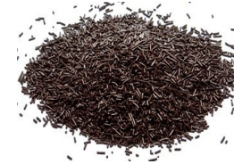
FIDEO VEGETAL NEGRO, CAJA 10 KG FIDEO VEGETAL NEGRO, CAJA 1 KG