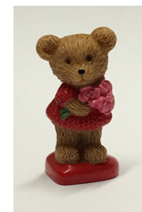
OSITO CUPIDO 5CM CAJA 12 UDS