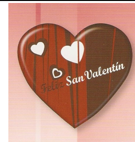
CORAZON CHOCOLATE FELIZ SAN VALENTIN 5x4,4CM ESTUCHE 54 UDS

JOSE LUIS SUPERVIA TEL: 876261627 FAX: 876261259 correo: dario@jlsupervia.es