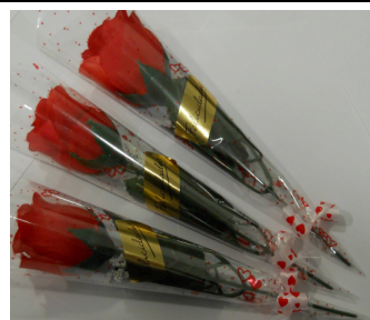
ROSA SAN VALENTIN